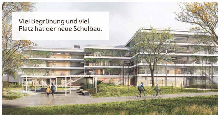
Viel Begrünung und viel Platz hat der neue Schulbau.

17., Hof des Gemeindebaus, Wattgasse 96-98, Telefon 01/245 03-17080, wohnpartner-wien.at