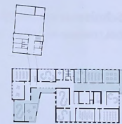
Grundriss 1. Etage