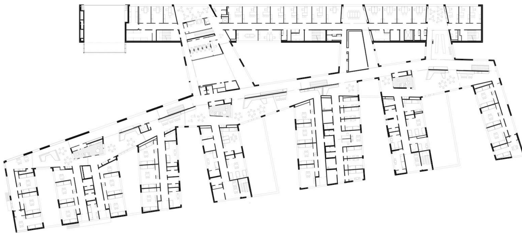
BILDUNTERSCHRIFT Grundriss des neuen Schubhaftzentrums: die Wohngruppen mit den Innenhöfen und das längliche Verwaltungsgebäude mit drei großen Verglasungen zur Strasse hin. Foto: Sue Architekten

MA In einer Wohngruppe - also einer WG – wohnen maximal 25 Menschen in ein- bis vierbettzimmern. Wichtig ist, dass die Einheiten überschaubar sind und eine gewisse, kritische Gruppengrösse nicht überschreiten; nur diese 25 haben Zutritt zu ihrer Wohngruppe. Als Zugangskontrolle gibt es an den Eingängen jeweils einen anmeldungspflichtigen Schalter, der integraler Bestandteil der Wohngruppen ist, und ähnlich wie ein Kiosk funktioniert: keine Kameras, verspiegeltes Glas, oder Erhöhungen, sondern ein direkter visueller Kontakt.