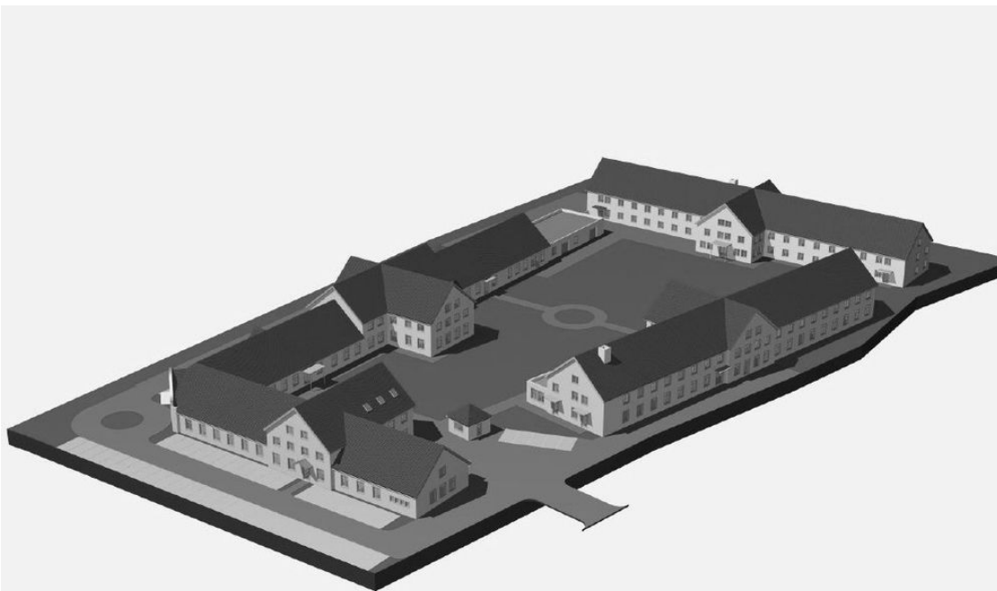
BILDUNTERSCHRIFT Der Entwurf für das Asylzentrum Eberau im Burgenland.