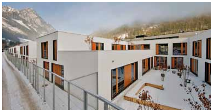
Blick in einen WG-Hof, der über zwei Zäune gesichert ist

Was klingt schöner: „Polizeigefangenenhaus“ oder „Polizeianhaltezentrum“? Und wie kann man „Abschiebung“ meliorisieren? Durch den Schub? Kommt dabei aus Abschiebehaft die Schubhaft heraus, müssen wir in Deutschland dreimal hinsehen, um dieses Wort zu verstehen. Denn Schub ist im deutschen Sprachraum etwas nach vorne Gerichtetes, der Schub steht für positives Wachstum und Energie; Abschiebung dagegen für Bürokratismus und ängstliche Hilflosigkeit.