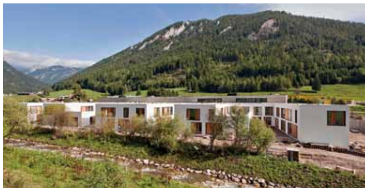
Luxuriöse Wohnanlage oder doch Gefängnis?