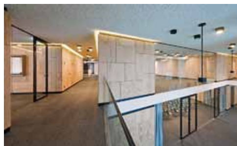
Hochwertige Materialien, gefängnisuntypische Grundrisse

Dass trotz aller gestalterischer Suche nach den Möglichkeiten in der detaillierten Ausschreibung am Ende dann doch ein Gefängnisbau am Ortsrand herausgekommen ist zeigt wohl, dass Architektur tatsächlich nur lindern, aber nicht verändern kann. Von diesem Entwurf ausgehend könnte jetzt aber eine Diskussion darüber geführt werden, ob die erwungene Illegalität von Migranten ohne Aufenthaltserlaubnis nicht gegen die UN-Charta verstoßen. Denn natürlich ist die Realisierung eines Schubhaftzentrums nichts weniger, als die gängige Praxis des Ausschließens und Zwischenlagerns von Menschen möglich zu machen; in allerdings einigermaßen menschenwürdigem Rahmen. Nicht den weggesperrten Illegalen sollten wir die Unterbringung schwer machen, schwer sollte es der Gesellschaft fallen, diese als Gefangene täglich zu erleben. Gibt es dafür aber eine architektonische Lösung? Be. K.