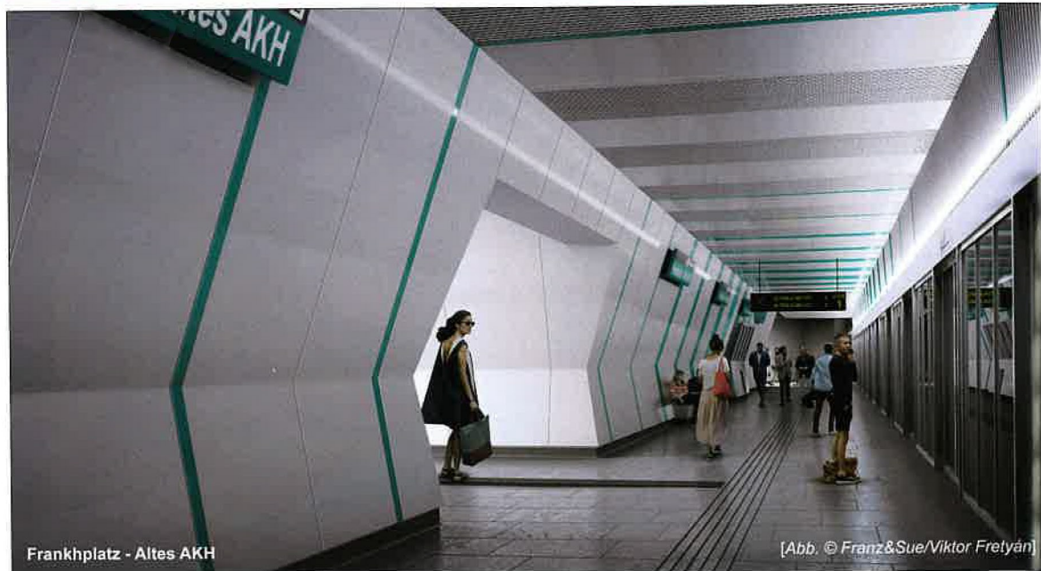
Frankhplatz - Altes AKH