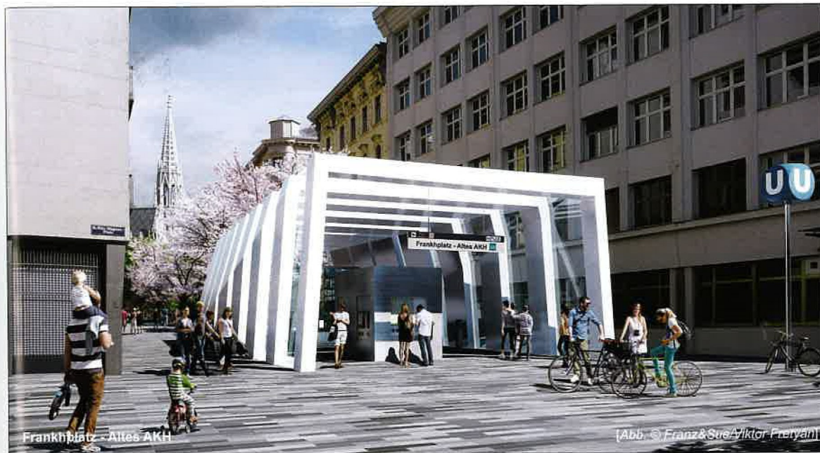
Frankhplatz - Altes AKH