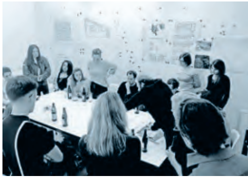
Architekten studieren und kritisieren ihre Projekte im Wiener «Fight Club».